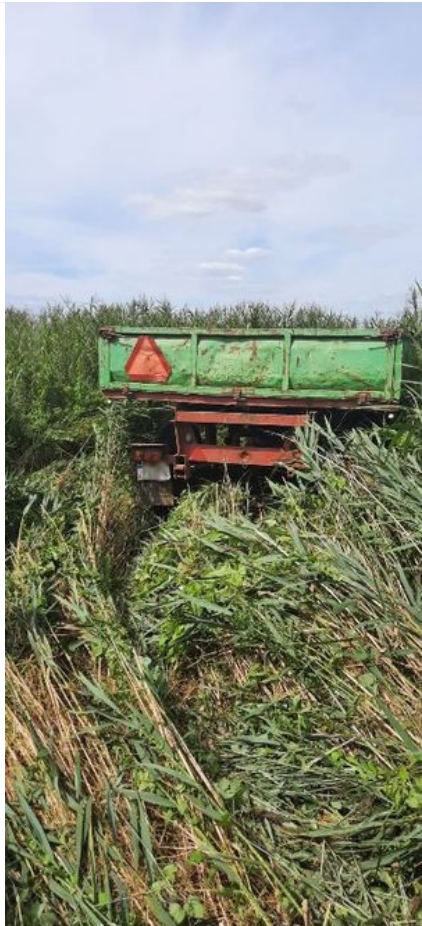
Ukradli ciągnik i przyczepę - usłyszeli zarzuty