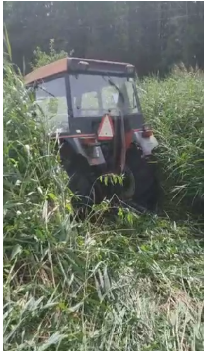
Ukradli ciągnik i przyczepę - usłyszeli zarzuty