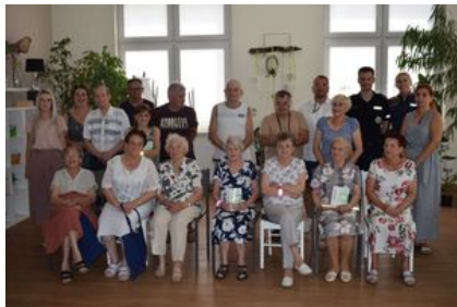
#8Wolsztyn - Policjanci z wizytą wśród seniorów