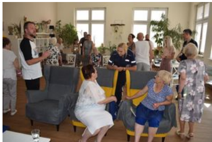
#7Wolsztyn - Policjanci z wizytą wśród seniorów