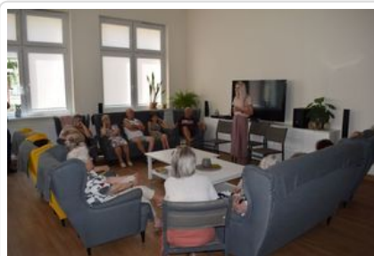
#2Wolsztyn - Policjanci z wizytą wśród seniorów