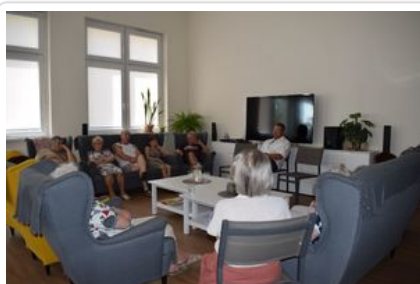
#4Wolsztyn - Policjanci z wizytą wśród seniorów