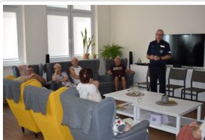
#1Wolsztyn - Policjanci z wizytą wśród seniorów

Na zakończenie poruszona została tematyka związana z bezpieczeństwem na drogach w odniesieniu do kierujących, jak i pieszych. Każdy z obecnych na spotkaniu otrzymał poradnik „Bezpieczne życie seniora” oraz opaskę odblaskową.