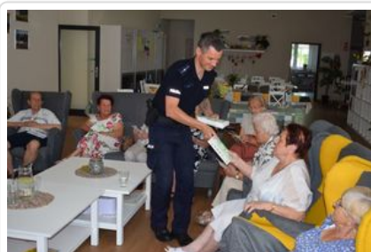
#5Wolsztyn - Policjanci z wizytą wśród seniorów