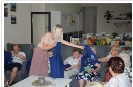
#6Wolsztyn - Policjanci z wizytą wśród seniorów