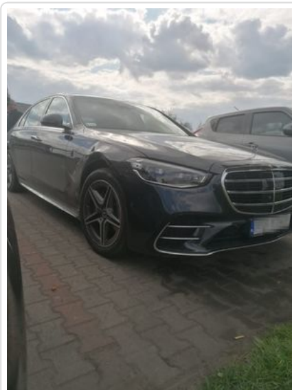
Kolizja podczas wyprzedzania