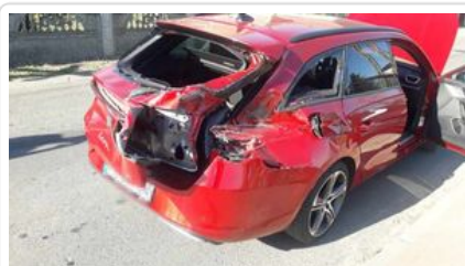
Starkowo - Zderzenie szynobusu z autem osobowym