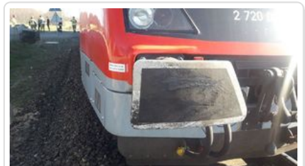
Starkowo - Zderzenie szynobusu z autem osobowym