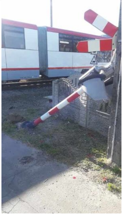
Starkowo - Zderzenie szynobusu z autem osobowym