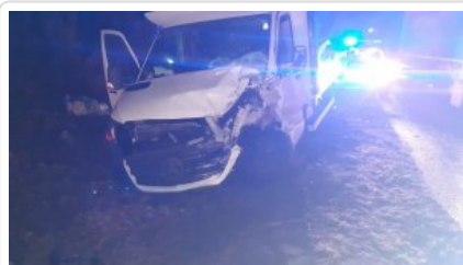
Powodowo-Żodyń - Zderzenie dwóch aut