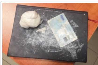
Wielen - O podejrzeniu przestępstwa zadecydowała karta płatnicza i ... biały nalot na nosie