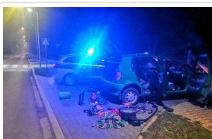
Wielen - O podejrzeniu przestępstwa zadecydowała karta płatnicza i ... biały nalot na nosie

Mężczyźnie zatrzymano prawo jazdy, usłyszał też zarzut posiadania narkotyków zagrożony karą pozbawienia wolności do 3 lat. Oprócz tego musi też liczyć się z odpowiedzialnością wynikającą z kierowania pojazdem mechanicznym pod wpływem narkotyków. Dziś Prokurator Rejonowy w Wolsztynie zastosował wobec niego środek zapobiegawczy w postaci dozoru policji.