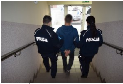
Wieleń - O podejrzeniu przestępstwa zadecydowała karta płatnicza i ... biały nalot na nosie