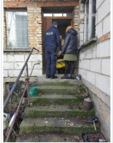
Wolsztyn - Aby święta były weselsze